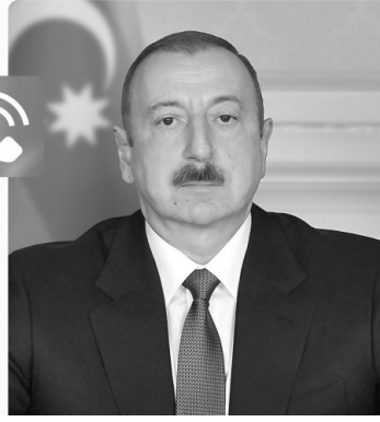
maraq doğuran digər məsələlər ətrafında fikir mübadiləsi aparılıb.

Prezidentin Mətbuat Xidmətinin məlumatına görə, Aleksandr Stubb İranda Azərbaycanın Naxçıvan Muxtar Respublikasına hücumu ilə əlaqədar ölkəmizə dəstəyini ifadə edib.