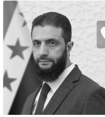
təhlükəsizliyinə və sabitliyinə mənfi təsir göstərə biləcək addımların qarşısının alınmasının zəruriliyi bildirilib.

Martin 10-da Suriya Ərəb Respublikasının keçid dövrü Prezidenti Əhməd Əl Şaraa Azərbaycan Respublikasının Prezidenti İlham Əliyevə zəng edib. Prezidentin Mətbuat Xidmətinin məlumatına görə, telefon söhbəti zamanı Yaxın Şərq regionunda yaranmış gərginlikdən narahatlıq ifadə olunub, region dövlətlərinin