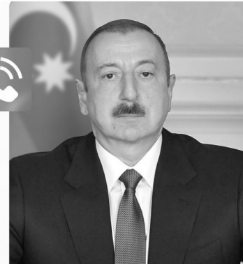
Telefon danışıqı əsnasında, eyni zamanda, Azərbaycan-Suriya ikitərəfli əlaqələrinə toxunub, münasibətlərin möhkəmləndirilməsində, müxtəlif sahələrdə əməkdaşlığın genişləndirilməsində hər iki tərəfin maraqlı olduğu bildirilib. Təmasların davam etdirilməsi barədə razılıq əldə olunub.